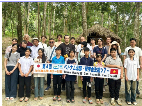
昨年6月のタンチャオ史跡訪問記念写真

訪問してくださった日本の20代前半の方々にとっても、現地の奨学金支援の生徒たちにとっても、生涯忘れられない貴重な体験と思い出となったようです。