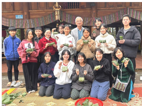
自分で作った「バイン・チュン」を手