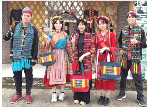
民芸品店で、少数民族の民族服を着て