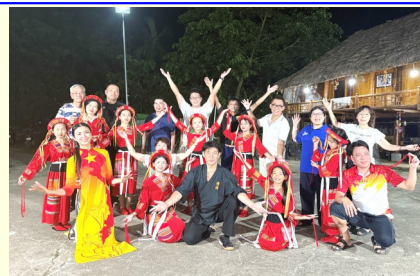
8月、スタディーツアーでのダンス交流

2017年のCSRスクエアの設立から毎年継続して実施してきている春や夏の北部スタディーツアーですが、ほぼ、活動内容が固まってきており、最も人気の高いものは、Na Hang湖でのボートクルーズと左の写真の滝壺でのドクターフィッシュとの出会いであり、また、右上の少数民族ダンスチームのパフォーマンスと交流のようです。