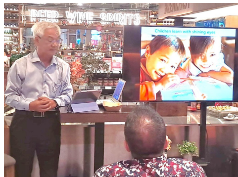
10年ぶりの英語での講演