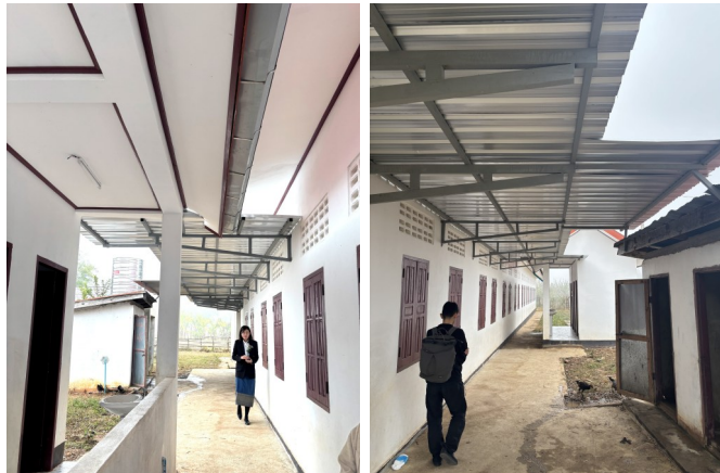
新校舎裏側の屋根のついたトイレへの通路

シエンクアン空港の工事のため、訪問できず、1年ぶりの訪問でした。現地では、12月19日(金)、モン族の正月のため、学校が休日にもかかわらず、215人の子供たちのうち、150人もの子供たちが、わざわざ集まってくれました。さらに、現地ペック郡のスポーツ教育局の副局長まで、臨席してくださり、贈呈式を開催することができました。