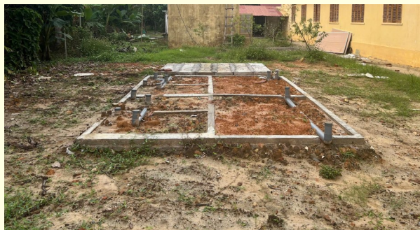
ドゥックニン小学校12月の現状

何とか、次の会報では、完成の報告ができるよう、現地の行政ならびに建設会社と完成をめざします。