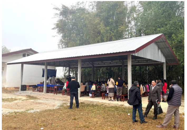
雨の日には、運動場としても使える100㎡の駐輪場