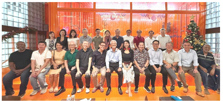
タンジョン・パガー駅近くのマーケットのイベント会場を借りて

11月11日(火)の夕方、講演会を開催すると、Jasonさんの友人たちなど、27人が集まってくれました。それに先だって、10日(月)の夕方には、芦沢