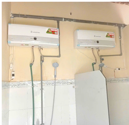
取り付けられた10台の電気温水器

※ シャワールームの床と壁(下部2/3)には、タイルを張り、今回の工事で、二つの部屋を合わせた部屋の中間には、パーティションを取り付けました。建物全体、内部も外部も塗装直しました。