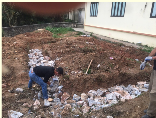
ソンナム小学校12月の現状