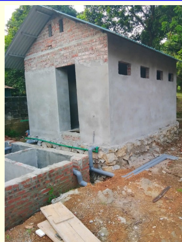
チャンフー小学校の12月の現状

一昨年、皆さまにご提案させていただき、多くの協賛とご支援をいただいておりますトゥエンクアン省、イエンスン郡、ルックハイン村のホップタイン小学校のトイレ建設ですが、省からの建設許可はやっと降りたのですが、財務省の許可や行政再編の影響を受けて、建設工事が遅れております。まだ、着工できない状態が続いています。