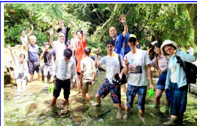
6月、奨学金支援での滝壺探検

現地の学校支援が目的ですので、必ずお土産を持参することになっています。静岡県(株)山田園様からの支援物資がとても役立っています。味付け海苔や手巻き海苔、バームクーヘン、クッキー、かつおふりかけなど、とても喜ばれ、助かっております。