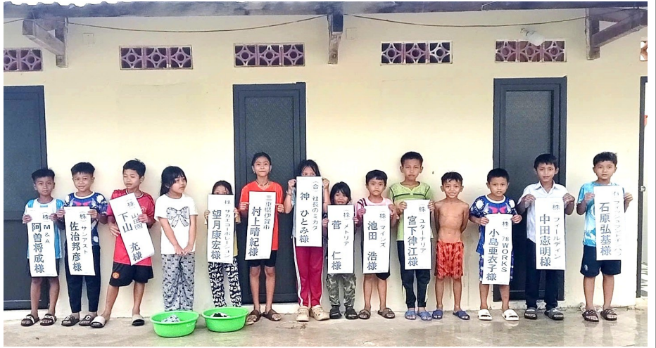
ベトナム中部、Quang Nam省、Tay Giang郡、A Dau小中学校シャワールーム・トイレ改修工事

ダン(旧アダウ)小中学校の寄宿舎で生活する家の遠い150の子供たちは、これで、真冬でも、温かい水で、シャワーを浴び、髪を洗うことができるようになりました。また、宿直の先生方も、2つの個室のシャワールームを使うことができるようになりました。