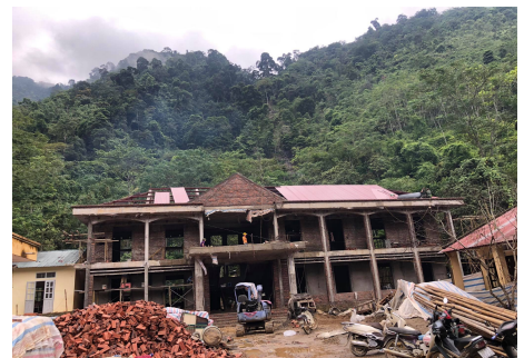
完成間近の二階建て校舎 (写真2)

そうした中、昨年の9月から提案してあったナキエン村のフックイエン小学校バンブック分校の全面改築と小規模水力発電所の建設が、日本国外務省の「草の根無償資金協力事業」として採択となり、3月9日にハノイの日本大使館で調印式でしたが、今回のコロナウィルス感染拡大予防のため、参列することができませんでした。しかし、建設は無事にスタートし、先月の9月20日には、5KWと8KWの発電機(写真1)で発電が始まり、学校だけでなく、近隣の15家庭に長年待望の明かりが灯りました。