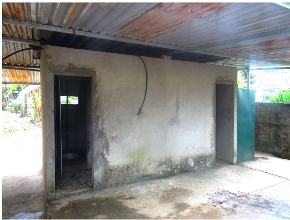
限られた予算で建設され、上塗りもされておらず、電気もない真っ暗なトイレ。屋根は波板スレートのため、夏の暑さは、耐えがたい。