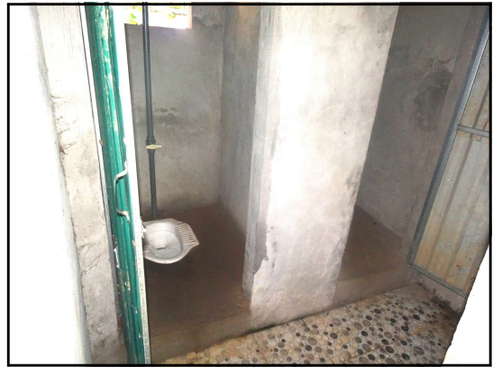
現在の、真っ暗で悪臭のひどい個室が2つだけの女子トイレ、129人の児童生徒と9人の先生方で、時間を争うように使わざるを得ない現状を、少しでも改善してあげたい。

先生方は、授業時間中にトイレを使うよう工夫し、子どもたちは、休み時間に列を作り、間に合わず、腹痛を訴える子どもも珍しくはありません。